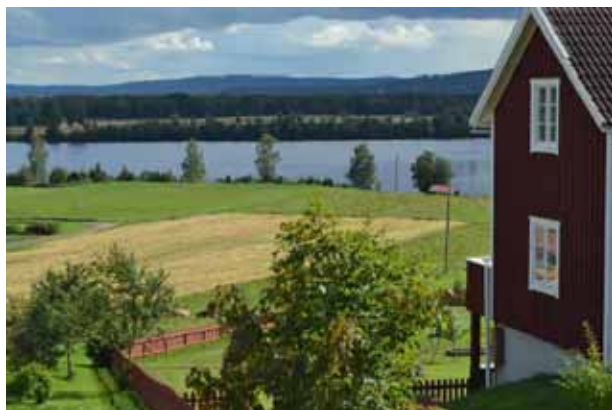
Utsikten från Hälla

Områdesbestämmelser finns över byarna Tibble, Ullvi, Hälla Romma, Berg Östra och Västra Rönnäs. Gällande detaljplaner finns i Lycka och Tibble.