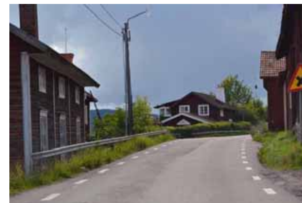
Länsvägen genom byarna

Norr om Lycka ligger en golfanläggning. Cykelled och vandringsled går genom odlingslandskapet mellan länsvägen och älven. Vandringsleder finns även i skogsmarkerna. Böle-Fallsbjörken är ett populärt besöksmål vid utsläppet av hästar under försommaren. Längs stranden finns flera badplatser och mindre båthamnar. I Tibble och i Västra Rönnäs finns kyrkbåthus vid stranden. I Tibble finns en dansbana och en ångbåtsbrygga.