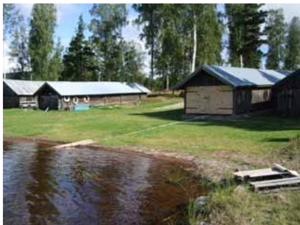
Kyrkbåthus i Västra Rönnäs

Länsvägen som går genom Lycka till och med Romma förorsakar buller och vibrationer. Hastigheten är begränsad till 30 resp 40 km/h. En skjutbana finns utanför planeringsområdet vid länsvägen till Sågmyra. I ett område från södra Tibble till norra Ullvi finns bebyggelse i högriskområde för radon. I planeringsområdet finns platser med risk för förorenad mark som ex verkstad, skrotupplag och avfallstippar. På andra sidan älven ligger Övermo reningsverk.