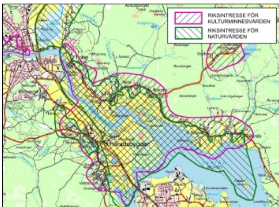
Riksintressen för naturvården och kulturmiljövården

I en kulturhistorisk miljöanalys beställd av Leksands kommun och utförd av Dalarnas museum (1983) utvärderades Ullvi by såsom riksintresse för kulturmiljövården. Värderingen fastställdes 1987-11-05 av Riksantikvarieämbetet (W2943).