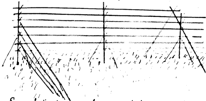
En hässa med en olika sorts Lasse i vardera ändan

Om man i min barndom visade en tidning eller en nyare bok för en gammal person fick man vanligen det svaret: "Jä kânn int läs laten." Med laten menades den latinska stilen som då alltmera undanträngde den gamla. I postillorna var de latinska orden tryckta med latinska bokstäver men detta klarade man så fint genom att, när man läste, rätt och slätt hoppa över dem. Men alla namn och dylikt som finnas på gamla föremål äro inristade med bokstäver hämtade just ur det latinska alfabetet. Ett A betyder Anna såvida det icke var krockar på det, för då var det en Anders, till exempel A A S = Anders Andersson, A A D = Anna Andersdotter. Ett O kallades en Ollö, ett P en Pällö, D Danil men betydde även dotter, L Lassö, J Jan och så vidare. Men icke nog med det. Även föremål som liknade dessa bokstäver fingo samma namn, till exempel de triangelformade ljushållarna i kyrkans fönster kallade en den gamla för Annör